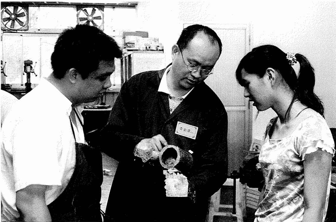
圖台大黑手通識課的指導老師不只有教授，還有一群雙手靈巧的黑手師傅。